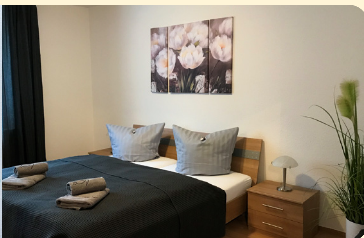
Gästewohnung Barbarossastraße 36