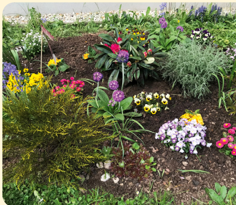
Neugestaltetes Beet mit Blumen