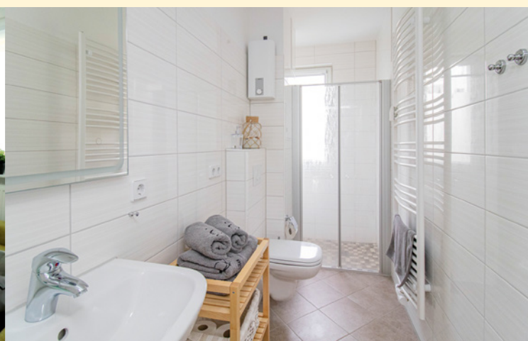
Gästewohnung Albert-Schweitzer-Straße 76