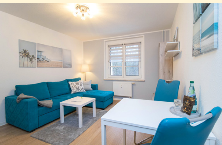
Gästewohnung Paul-Jäkel-Straße 82