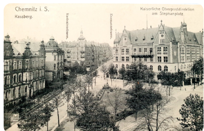
Historische Ansichtskarte Stephanplatz (Stiftung Post Berlin)