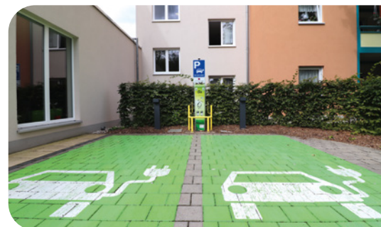
Ladestandort Eislebener Straße