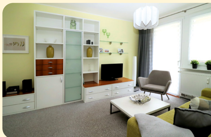
Gästewohnung Albert-Schweitzer-Straße 24

Die Kosten für die Endreinigung sind im Preis für die erste Übernachtung enthalten. Alle Preise verstehen sich inklusive der aktuell gültigen Mehrwertsteuer.