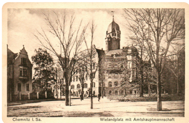
Historische Ansichtskarte Wielandplatz

und Metzschstraße (heute Emil-Rosenow-Straße). Vor dem Hintergrund von Kriegsschäden und Enttrümmerung verschwand dieser Platz und ging in der Reichsstraße auf. Der Stephanplatz existiert heute noch, spielt aber von seiner Größe eher eine untergeordnete Rolle. Wir wollen den André-